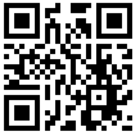
ดาวน์โหลดเอกสารการประชุม

เพื่อความสะดวกรวดเร็วในการลงทะเบียน ผู้ถือหุ้น และ/หรือ ผู้รับมอบฉันทะ โปรดนำแบบแจ้ง การประชุมที่ได้จัดพิมพ์บาร์โค้ด มาแสดงต่อเจ้าหน้าที่ลงทะเบียนในวันประชุมด้วย