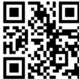
ดาวน์โหลด IFA Report